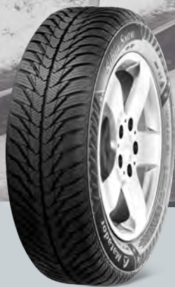
MP54 Sibir Snow

Ponuka zimných pneumatík 2016/2017 pre osobné, 4×4/SUV a dodávkové vozidlá.