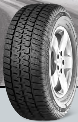
MPS530 Sibir Snow VAN