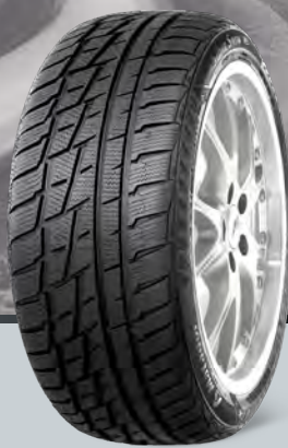
MP92 Sibir Snow SUV